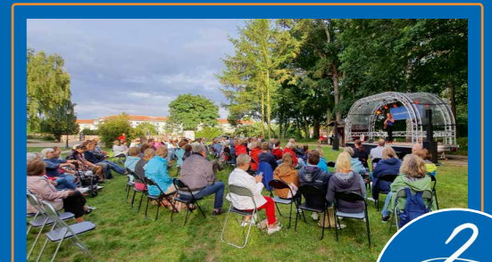
Kurpark, Bühne am Brunnen