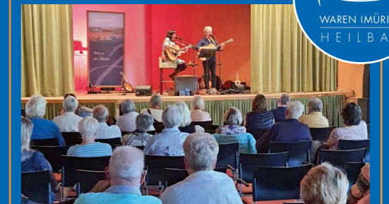
Kursaal des Kurzentrums