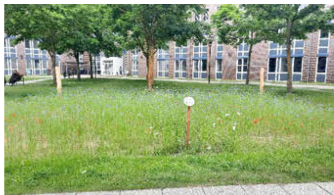
Blühfläche am Amtsbrink

Viele Insektenarten finden heute immer weniger geeignete Lebensräume. Blühflächen schaffen genau diese Rückzugsorte. Sie liefern vom Frühjahr bis in den Herbst hinein Nektar und Pollen und helfen so dabei, die biologische Vielfalt vor Ort zu erhalten. Von den Insekten profitieren wiederum viele andere Tiere, wie Vögel und Kleinsäuger. Zudem sind die Flächen nicht nur ökologisch wertvoll, sondern bereichern auch das Stadtbild. Die wechselnden Farben und Blüten schaffen attraktive Blickpunkte und somit eine schöne Atmosphäre