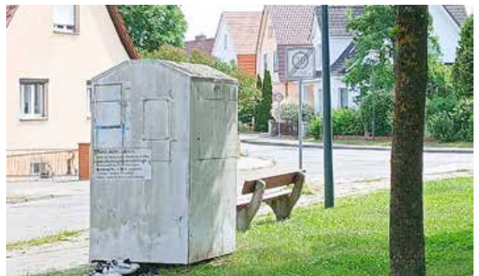
Altkleidercontainer „Am Ellernbruch“

Um die verbleibenden Sammelangebote zu sichern, ist ein bewusster Umgang mit den Containern entscheidend: Nur saubere und tragbare Kleidung gehört hinein. Stark verschmutzte oder nicht mehr nutzbare Textilien sind weiterhin über die Restmülltonne zu entsorgen.