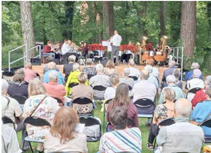
Posaunen 29. Mai 2026