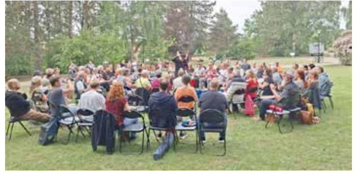
DrumCircle 2. Juni 2026

alternative. So können die Dienstagskonzerte bei Starkregen in den Kursaal verlegt, wenn dort nicht gerade eine eigene Veranstaltung läuft. Beide Veranstaltungsorte sind nur 4-5 Gehminuten voneinander entfernt. Es lohnt sich also immer, in den Kurpark zu gehen. Alle Informationen zu den Terminen sind im Flyer sowie auf der städtischen Homepage zu finden. Über wetterbedingte Verschiebungen informiert auch tagesaktuell die Waren (Müritz)-Information oder natürlich die städtische Internetseite bzw. der WhatsApp-Kanal der Stadt Waren (Müritz).