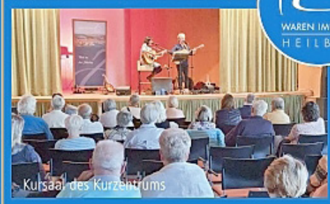
Kursaal des Kurzentrums