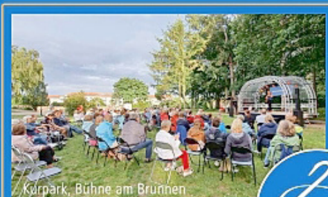
Kurpark, Bühne am Brunnen

Eröffnungskonzert am 1. Juni mit dem Warener Blasorchester im Kursaal