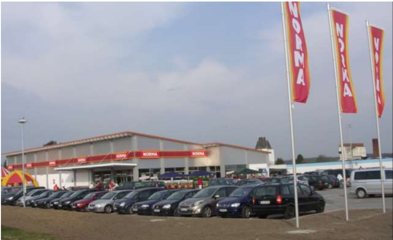
Abbildung 6 Ansicht eines NORMA-Einkaufsmarkts im aktuellen Design

Der NORMA-Einkaufsmarkt wird entsprechend dem Firmenstandard mit einseitig geneigtem Pultdach errichtet. Aussagen zur Gestaltung (Ansichten der Hochbauplanung) werden im Durchführungsvertrag geregelt.