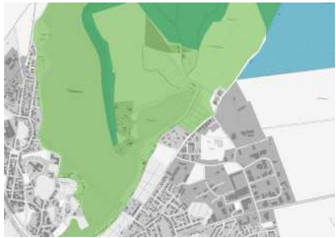
Abbildung 5 FFH-Gebiet (blau), LSG (grün)

Darin eingeschlossen liegt in einem Abstand von gut 600 m zum Plangebiet das FFH-Gebiet DE 2442-301 Wald- und Kleingewässerlandschaft nördlich von Waren (Müritz). Das FFH-Gebiet greift nördlich des Siedlungsgebietes nach Osten über die Gievitzer Straße hinaus (Abstand zum Plangebiet ca. 700 m) und umfasst hier auch Flächen außerhalb des LSG.