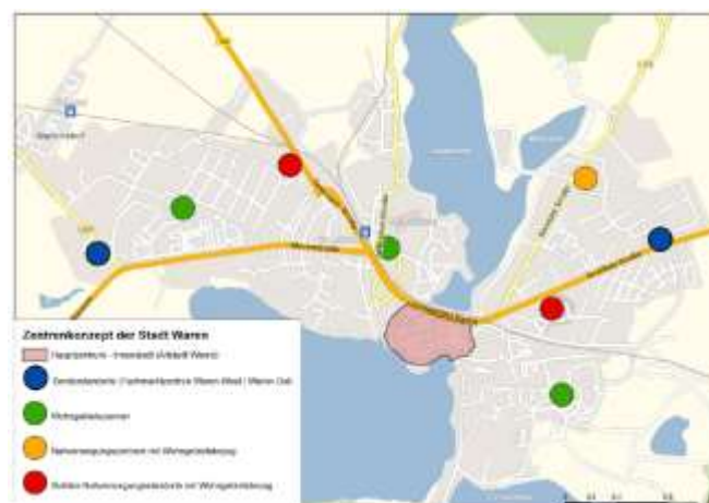
Abbildung 3 Zentrenkonzept mit Nahversorgungsstandort Gievitzer Straße als Nahversorgungsstandort mit Wohngebietsbezug

Das Plangebiet wurde in den 90er Jahren mit einem Einkaufszentrum bebaut, das ursprünglich aus einem Lidl-Markt mit rund 660 qm Verkaufsfläche, einem Reno-Schuhmarkt mit ca. 400 qm Verkaufsfläche, einem Bäcker sowie einer Gaststätte bestand. Im Obergeschoss des winkelförmigen Baus war ein Fitnessstudio untergebracht. Derzeit wird das Gebäude nur noch von einem NORMA-Markt genutzt.