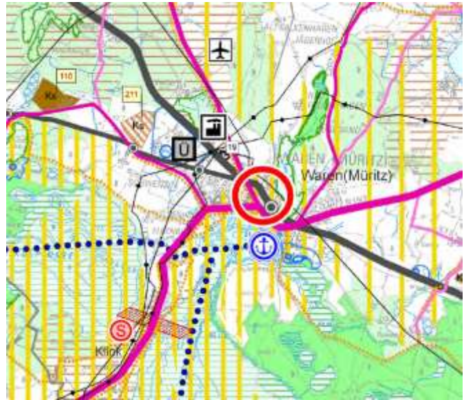
Abbildung 1 Regionales Raumentwicklungsprogramm (Ausschnitt)

Die Stadt Waren (Müritz) ist entsprechend dem aktuellen Regionalen Raumentwicklungsprogramm Mecklenburgische Seenplatte (RREP) Mittelzentrum, das den zugewiesenen Mittelbereich mit Leistungen des gehobenen Bedarfs versorgen soll. Darüber hinaus sind die Gemeinden Grabowhöfe, Groß Dratow, Groß Gievitze, Groß Plasten, Hinrichshagen, Hohen Wangelin, Jabel, Kargow, Klink, Klocksin, Lansen-Schönau, Moltzow, Neu Gaarz, Schloen, Schwinkendorf, Torgelow am See, Varchentin, Vielitz, Vollrathsrue sowie der stadtbereich von Waren (Müritz) als Nahbereich zugeordnet, für den eine Versorgung mit Leistungen des qualifizierten Grundbedarfs vorzusehen ist.