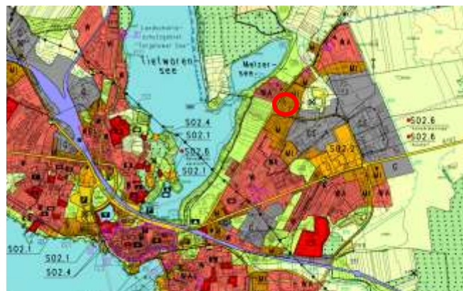
Abbildung 2 Flächennutzungsplan (Ausschnitt) mit Lage des Plangebiets

Der vorhabenbezogene Bebauungsplan entspricht mit der Flächendarstellung als Sonstiges Sondergebiet „Nahversorgung“ für großflächigen Einzelhandel im Sinne des § 11 BauNVO nicht den Vorgaben des Flächennutzungsplans. Der Flächennutzungsplan wird nach In-Kraft-Treten des vorhabenbezogenen Bebauungsplans im Wege der Berichtigung angepasst.