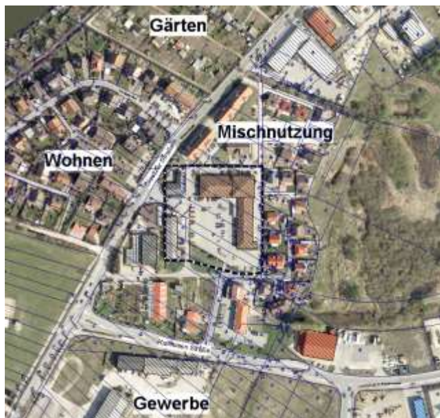
Abbildung 4 Abgrenzung Nahversorgungszentrum gem. Zentrenkonzept 2007

Im Rahmen einer Auswirkungsanalyse zum NORMA-Standort durch BBE Handelsberatung GmbH (Hamburg, Mai 2016) mögliche wurden Auswirkungen der Standorterweiterung gutachterlich untersucht (vgl. Abschnitt 3.1) und hierzu die Einzelhandelssituation in der Stadt Waren (Müritz) erneut erhoben. Demnach verfügt die Stadt Waren (Müritz) über eine nahversorgungsrelevante Verkaufsflächenausstattung von rd. 18.300 m 2 (incl. der in Bau befindlichen stationären Verkaufsfläche des Edeka-Marktes Teterower Straße), auf denen ein Einzelhandelsumsatz von rd. 77 Mio. EUR erwirtschaftet wird. Als Betriebsformen lassen sich derzeit ein SB-Warenhaus (familia), fünf größere Lebensmittelmärkte (Edeka und Sky) sowie neun Lebensmitteldiscounter (2 x Aldi, 2x NORMA, Penny, 2x Netto Stavenhagen, Netto-Markendiscout, Lidl) differenzieren. Das Angebot wird darüber hinaus von Betrieben des Lebensmittelhandwerks (Bäckereien, Metzgereien) sowie Getränke- und Drogeriefachmärkten ergänzt, die jedoch nur eine eingeschränkte Wettbewerbsrelevanz zum Planvorhaben aufweisen.