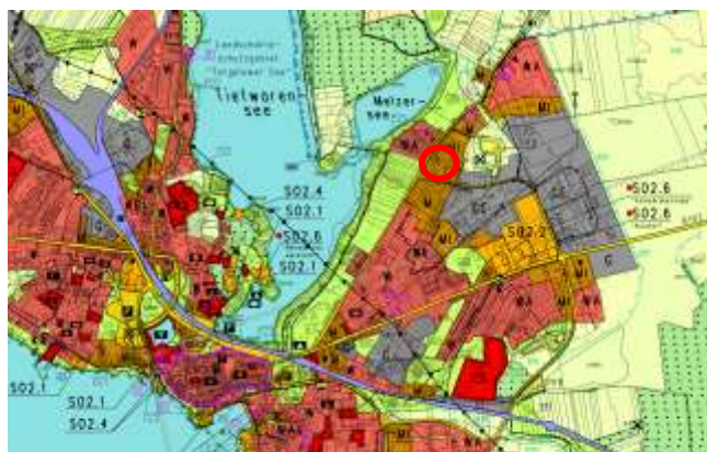
Abbildung 2 Flächennutzungsplan (Ausschnitt) mit Lage des Plangebiets

Der vorhabenbezogene Bebauungsplan entspricht mit der Flächendarstellung als Sonstiges Sondergebiet „Nahversorgung“ für großflächigen Einzelhandel im Sinne des § 11 BauNVO nicht den Vorgaben des Flächennutzungsplans. Der Flächennutzungsplan wird nach In-Kraft-Treten des vorhabenbezogenen Bebauungsplans im Wege der Berichtigung angepasst.