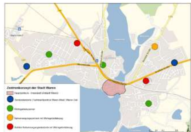
Abbildung 3 Zentrenkonzept mit Nahversorgungsstandort Gievitzer Straße als Nahversorgungsstandort mit Wohngebietsbezug