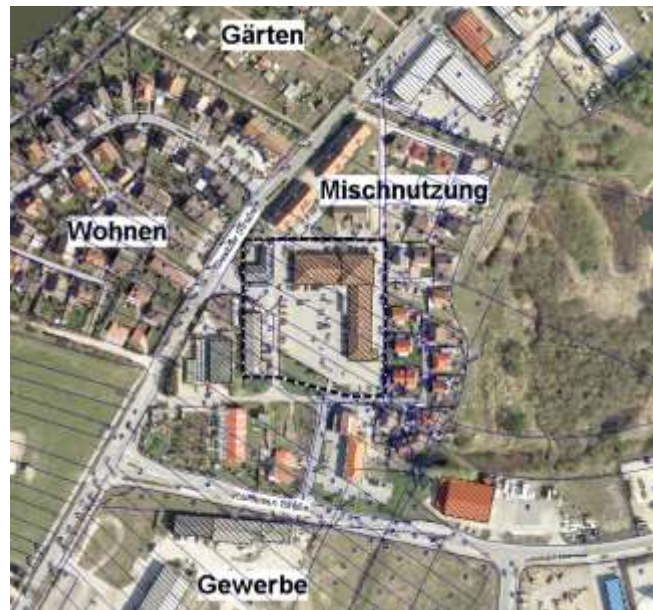
Abbildung 4 Abgrenzung Nahversorgungszentrum gem. Zentrenkonzept 2007

Grundsätzlich wurde im Mischgebiet die Zulässigkeit von Einzelhandelsbetriebe abweichend vom Regelkatalog des § 6 BauNVO stark eingeschränkt. Nicht zentrenrelevanter Einzelhandel wurde nur ausnahmsweise, zentrenrelevanter Einzelhandel überhaupt ausgeschlossen. Für den Planbereich wurde im Sinne einer Fremdkörperregelung nach § 1(10) BauNVO festgesetzt, dass die damals bereits bestehenden Einzelhandelsbetriebe (Lebensmittelmarkt, Schuhladen, Textilgeschäft, Fleisch- und Wurstwaren, Bäcker, Geschenkartikel) mit zentrenrelevantem Sortiment mit bis zu