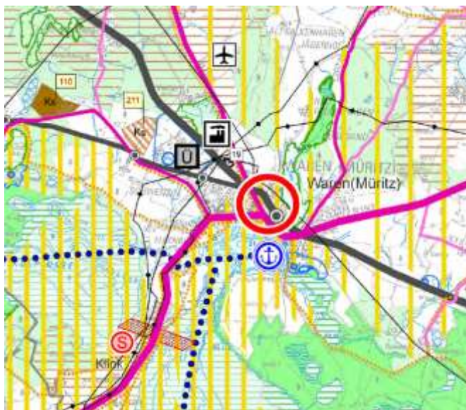
Abbildung 1 Regionales Raumentwicklungsprogramm (Ausschnitt)

Die Stadt Waren (Müritz) ist entsprechend dem aktuellen Regionalen Raumentwicklungsprogramm Mecklenburgische Seenplatte (RREP) Mittelzentrum, das den zugewiesenen Mittelbereich mit Leistungen des gehobenen Bedarfs versorgen soll. Darüber hinaus sind die Gemeinden Grabowhöfe, Groß Dratow, Groß Gievitze, Groß Plasten, Hinrichshagen, Hohen Wangelin, Jabel, Kargow, Klink, Klocksin, Lansen-Schönau, Moltzow, Neu Gaarz, Schloen, Schwinkendorf, Torgelow am See, Varchentin, Vielitz, Vollrathsrue sowie der stadtbereich von Waren (Müritz) als Nahbereich zugeordnet, für den eine Versorgung mit Leistungen des qualifizierten Grundbedarfs vorzusehen ist.