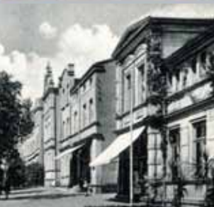
Moltkestraße 1930 heute Mozartstraße