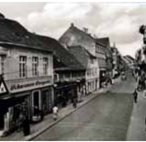
Lange Straße 1930