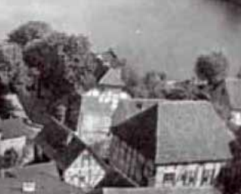
Warener Synagoge 1930