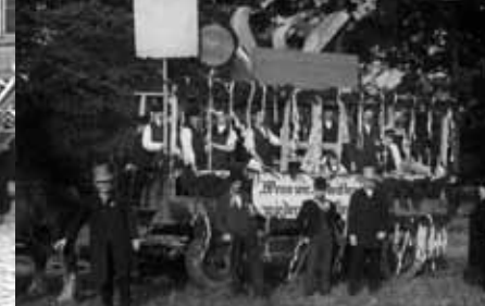
1. NS Feiertag · 1. Mai 1933