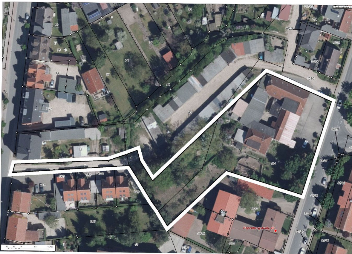
Abbildung 1: Übersicht Geltungsbereich.

Das Vorhabensgebiet liegt im Landkreis Mecklenburgischen Seenplatte in der Stadt Waren (Müritz) an der Papenbergstraße. Der Geltungsbereich umfasst in der Gemarkung Waren in der Flur 41 die Flurstücke 71, 101 und teilweise 99. Auf Letzterem befinden sich einige Gehölze, wie Robinien, Birken, Obstgehölze als auch Kiefern. Da das umzäunte Gebiet nicht genutzt wird, ist eine zunehmende Verbuschung durch Brombeerbüsche erkennbar. Auf dem Flurstück 101 stehen mehrere alte, massive Gebäudekomplexe und ein Einfamilienhaus mit angrenzendem Garten nach Süden. Innerhalb dessen befinden sich Ahornbäume, ein Walnussbaum, eine Eibe als auch mehrere alte Lebensbäume. Mit dem Bebauungsplan sollen die städtebaulichen Voraussetzungen geschaffen werden, um den Neubau von Wohngebäuden zu ermöglichen. Aufgrund des geringen gesamten Platzangebotes und der Anforderung einer möglichst hohen Nachverdichtung müssen alle vorhandenen Strukturen beseitigt werden. Dies betrifft sowohl die Bäume als auch die Gebüschstrukturen innerhalb des Plangebietes.